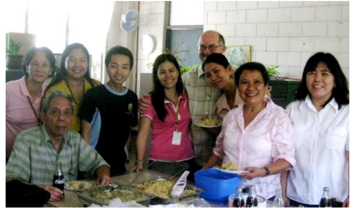
Un anniversaire qui ne passe pas inaperçu