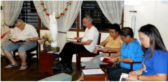
Les liens s'affermissent autour du Père.