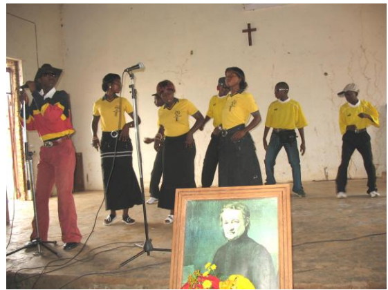
Le concert religieux lors de la fête mennaisienne

Tout l'après-midi se passait sur le terrain de sport, d'abord pour un match de volley entre élèves et professeurs, avec la victoire de ces derniers, puis un grand match de foot où la 6 ième scientifique a battu la 4 ième pédagogique.