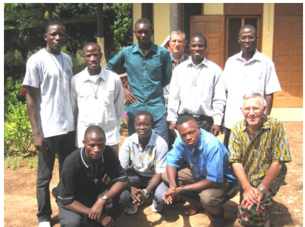
Les novices de Dapaong avec leurs formateurs