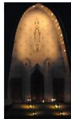
Basilique N-D du Cap

Dans la Famille mennaisienne, d'autres ont besoin de vos expériences, de votre regard, de sentir votre manière de relever les défis qui se présentent, dans les actions et projets menés, dans les équipes et les relations entre laïcs et religieux.