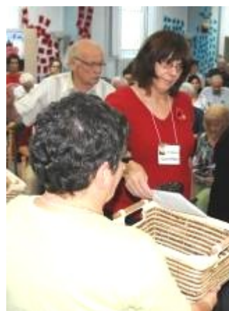
Engagement envers la Parole