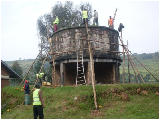
RÉFECTION DU CHÂTEAU D'EAU

La nouvelle école primaire qui est voisine de la nôtre sera inaugurée au début de février. J'y reviendrai.