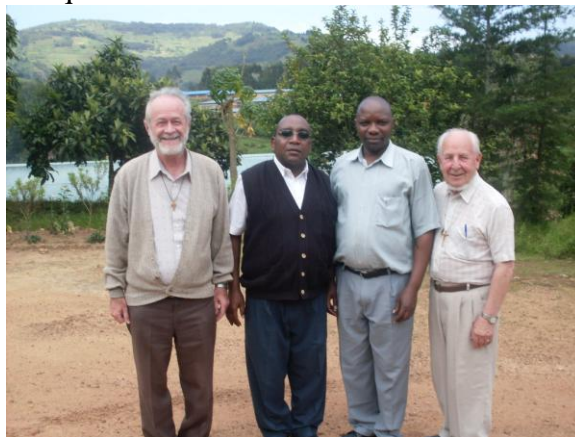
COMMUNAUTÉE DE KIRAMBO 2009-2010